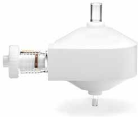
Рис. 2. Съемная стеклянная двухпроходная распылительная камера в корпусе из теплопроводного полимерного материала, легко поддающегося очистке.

Камера IsoMist является компактным прибором повышенной прочности, который можно с легкостью достать для очистки или планового технического обслуживания.